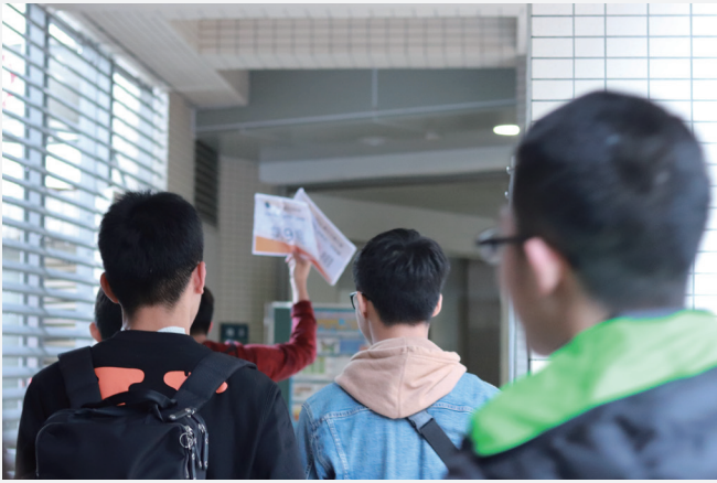
高中生們列隊前進，準備前往實驗室大開眼界。