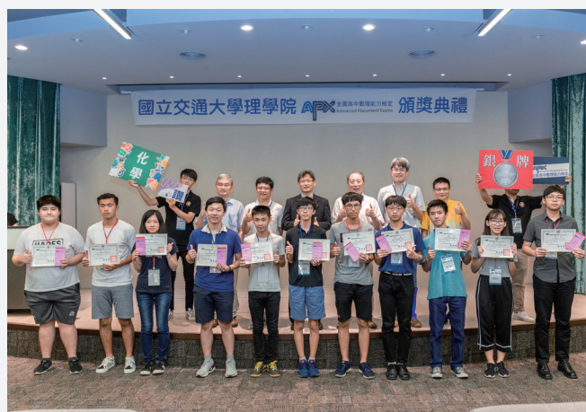
頒獎典禮化學科銀牌獎得主合影。

有位擔任高中物理科老師的學生家長更表示，她很高興看到交大理學院能辦理這個「讓學生有機會檢視自己的學習成效，