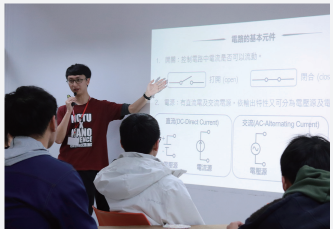
在奈米系的教室裡，學生專心聽學長講解如何組電路板。

若你已經對心目中嚮往的系所有一定了解，並且打定主意要加入交大這個大家庭，那麼絕不能錯過各系定時舉辦的實驗室導覽。要是以往理化課所做的實驗、使用的器材已經激起你濃厚的興趣，那麼這次的參訪除了能一睹科學實作的高級殿堂，還會讓你鬥志高昂，許下成為交大學生的願望。