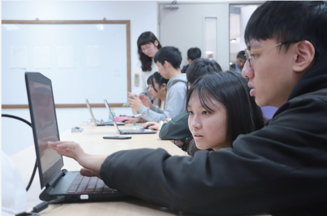
學長耐心分析落點，向有疑惑的高中生解釋各校系優缺點。