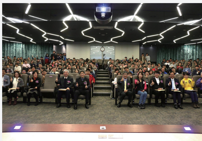
上午第一場說明會的次軒廳，221個座位的會場座無虛席。