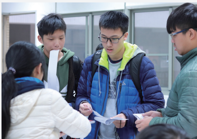
看起來很普通的紙卡，其實饒富數學的趣味。

如果你決心走上追尋理科知識的這條路，這個博覽會完全是命中註定的小幸運，緩步環繞一圈，你可以在應數系攤位領取DIY紙卡，在摺紙過程中，觀察數學與結構的相輔相成；你也能走進應化系教室，詢問自己能夠預習什麼科目，並翻閱實體陳列的原文書，一親元素奧秘的芳澤；你還可以在生科系報名體驗植物組織培養，想像實驗室裡，你的身影穿梭，孵育一株珍貴的花朵，為世界帶來改變；現場還能參與奈米系的工作坊，自己從零到有製作電路板，將高中所學關於電的知識實體化，並驚嘆於這個科系學習觸角之廣。