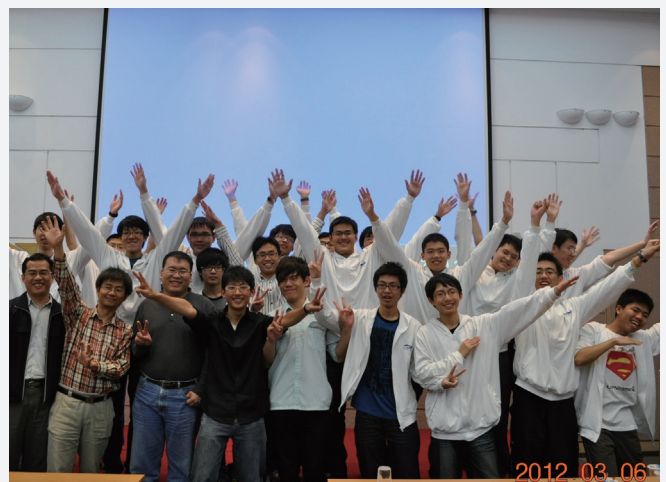
2012 年專題研究成果發表會。完成時日以來的心血展示，師生們開心留下合影。

學生及早接觸學術領域，以培育和啟蒙其科學潛力；學生修畢課程後，由本校給予學期成績單。