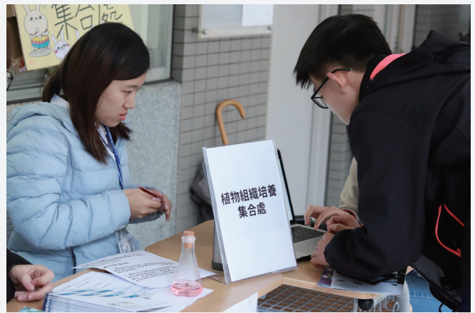
生科系舉辦的植物組織培養體驗，吸引高中生報名參加。