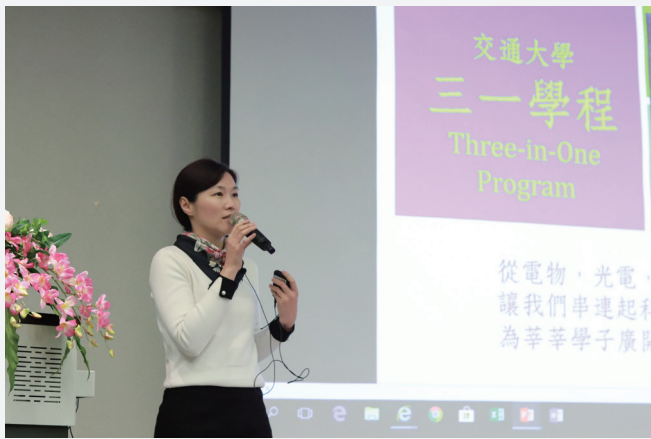
面對變化莫測的未來趨勢，「三一學程」提供學生跨領域能力的培養搖籃。

如果你決心走上追尋理科知識的這條路，這個博覽會完全是命中註定的小幸運，緩步環繞一圈，你可以在應數系攤位領取DIY紙卡，在摺紙過程中，觀察數學與結構的相輔相成；你也能走進應化系教室，詢問自己能夠預習什麼科目，並翻閱實體陳列的原文書，一親元素奧秘的芳澤；你還可以在生科系報名體驗植物組織培養，想像實驗室裡，你的身影穿梭，孵育一株珍貴的花朵，為世界帶來改變；現場還能參與奈米系的工作坊，自己從零到有製作電路板，將高中所學關於電的知識實體化，並驚嘆於這個科系學習觸角之廣。