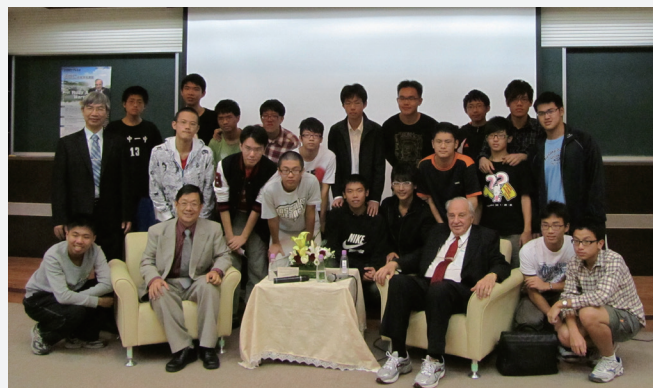
2011 年台中一中科學班學生一同參與台聯大系統溫世仁講座之學術演講，親臨感受諾貝爾獎得主 Rudy A. Marcus 教授的大師風範。

再者，為打開科學班學生的視野，本校把握各項學術活動機會讓科學班學生一同參與，例如：2011 年「台灣聯合大學系統溫世仁卓越學術講座」邀請 1992 年諾貝爾化學獎得主 Rudy A. Marcus 教授至本校演講，藉由諾貝爾大師的現身說法，開拓科學班學生們的國際視野；更舉辦全國科學班聯合暑期科學營，齊聚建國中學、師大附中、實驗高中、台中一中、台南一中及高雄中學等六所高中科學班，由交大電機、資訊、工、理、生科學院編排課程，本校教授親自授課，讓學生們提前體驗大學生活，也把握機會和各校菁英相互切磋，是一段非常難得的學習歷程。