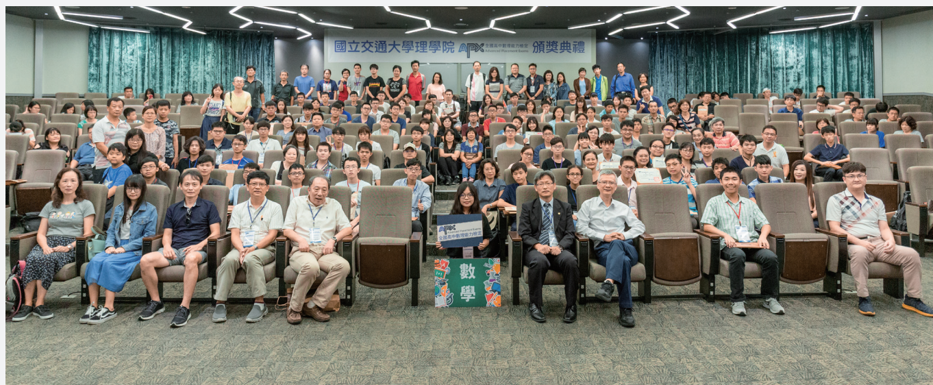
頒獎典禮數學科金銀銅牌學生與師長合影。

教育是百年大計，人才的培育是看長不看短，而教育既是本於「樹人」，師與生是教、學相長的互利關係，因此教育政策的擬定更要宏觀專業，執行細節則因才施教。學生品德的養成來自身教，家庭、學校與社會都負有重要責任。為師長者以身作則，師生從中體會教與學的樂趣，藉由自身態度影響觀念，藉由觀念來改變行動，讓教育充滿無限的生命力，身為教育單位的一員，就讓我們一起努力，從自身做起，讓台灣的教育發光發熱！