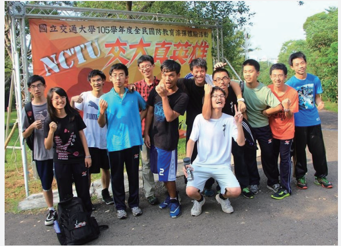
2016 年台中一中學生在交大校園的特色活動體驗。

第二階段學程（高三加深加廣），學生於在學期間通過科學班聯合資格考，得繼續修讀這個階段學程，學生進入交大選修大學開設的相關科目學分，並在本校教授的指導下，進行個別科學研究，使菁英